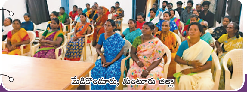
మేడికొండూరు, గుంటూరు జిల్లా