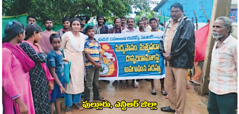
పుల్లూరు, ఎస్టిఆర్ జిల్లా