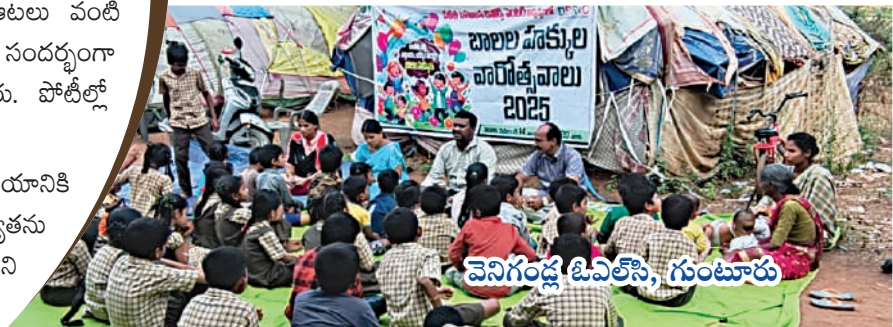
వెనిగండ్ల ఓవెలసె, గుంటూరు