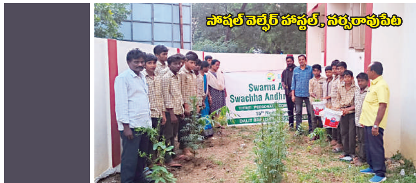
నాషల్ వెల్ఫేర్ హాస్టల్, నర్సరావుపేట