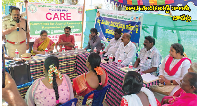
గాది వెంకటరెడ్డి కాలనీ, బాపట్ల