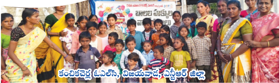
కంచికచెర్ల ఓవెలసె, విజయవాడ, ఎన్టీఆర్ జిల్లా