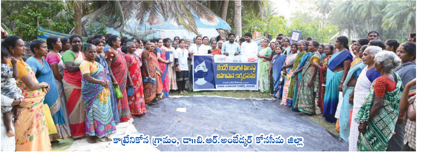
కాట్రేనికోన గ్రామం, డా॥బి.ఆర్.అంబేడ్కర్ కోనసీమ జిల్లా