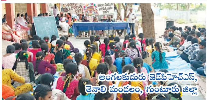
అంగలకుడురు జెడ్పిహెచ్ఎస్, తెనాలి మండలం, గుంటూరు జిల్లా