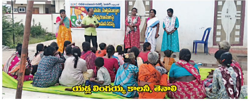
యడ్ల లింగయ్య కాలనీ, తెనాలి