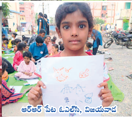
ఆర్ఆర్ పేట ఓవెలసె, విజయవాడ