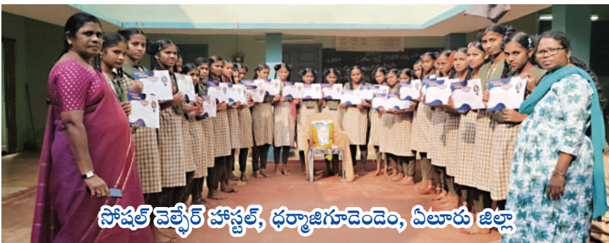
సోషల్ వెచ్చేర్ హాస్టల్, ధర్మాజిగుడెండెం, ఏలూరు జిల్లా

రాష్ట్ర వ్యాప్తంగా 77వ రాజ్యాంగ ఆమోద దినోత్సవ వేడుకలను ఘనంగా నిర్వహించారు. విద్యార్థుల్లో రాజ్యాంగ స్పృహను పెంచడమే లక్ష్యంగా పలు కార్యక్రమాలు చేపట్టారు. రాష్ట్రం లోని పలు విద్యాలయాల్లో వ్యాస రచన, క్విజ్ పోటీలు నిర్వహించారు. ఈ పోటీల్లో విద్యార్థులు ఉత్సాహంగా పాల్గొన్నారు. భారత రాజ్యాంగ రూపకల్పనలో డా.బి.ఆర్. అంబేద్కర్ కీలకపాత్ర పోషించారు. గౌరవం, సమానత్వం, సామాజిక న్యాయం వంటి విలువలను రాజ్యాంగంలో స్థిరపరచిన మహానేతగా ఆయనను నిర్వాహకులు స్మరించారు.