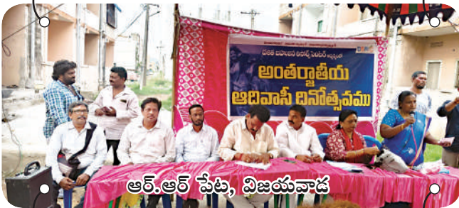
ఆర్.ఆర్ పేట, విజయవాడ