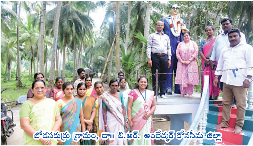
బోడసకుర్తు గ్రామం, డా॥ బి.ఆర్. అంబేద్కర్ కోససీమ జిల్లా