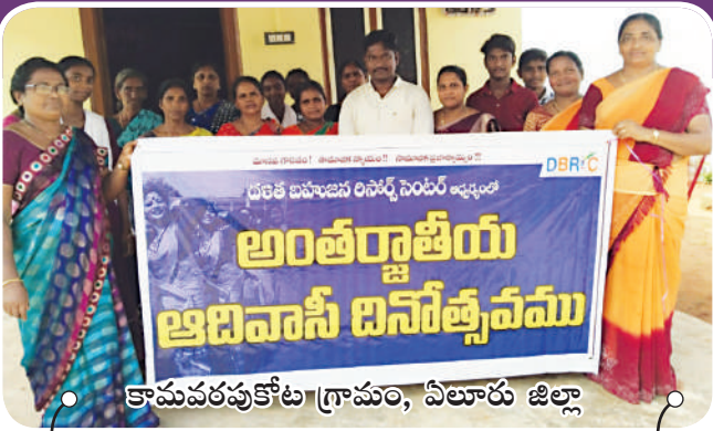
కామవరపుకోట గ్రామం, ఏలూరు జిల్లా