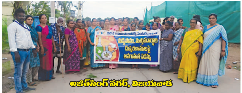
అజిత్ సింగ్ నగర్, నిజయనాథ