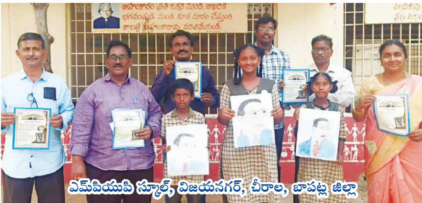
విమ్పియుపి స్కూల్, విజయనగర్, చీరాల, బాపట్ల జిల్లా