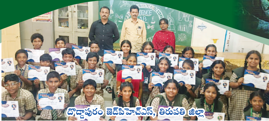
దొడ్డాపురం జెడ్పిహెచ్ఎస్, తిరుపతి జిల్లా