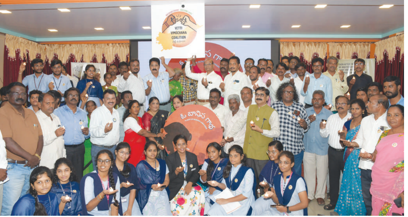
విజయవాడ ఆంధ్ర లయోలా కళాశాల ఆవరణలో రాష్ట్ర లోని ఎన్నో ఓలు సంయుక్తంగా ఏర్పాటు చేసిన “వెట్టి విమోచన కౌయూలూషన్” ఆవిర్భావ సభలో లోగోను ఆవిష్కరించి ప్రతిజ్ఞ చేస్తున్న దృశ్యం