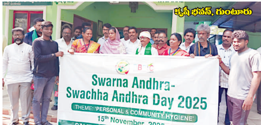
కృష్ణ భవన్, గుంటూరు