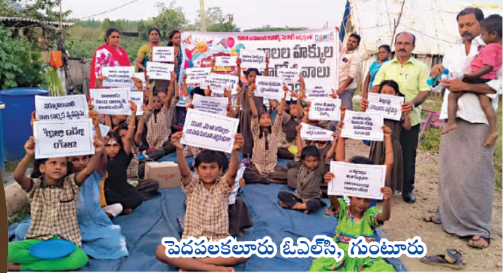
పెదవలకలూరు ఓవెలసె, గుంటూరు

ఉపాధ్యాయులు, కమ్యూనిటీ వాలంటీర్లు కార్యక్రమాల విజయానికి తోడ్పడ్డారు. తల్లిదండ్రులు కూడా పాల్గొని బాలల హక్కుల ప్రాముఖ్యతను గుర్తించారు. బాలల హక్కుల పరిరక్షణ ప్రతి ఒక్కరి బాధ్యత అని డిబిఆర్సి ప్రతినిధులు పేర్కొన్నారు. ఈ కార్యక్రమాలు పిల్లల్లో సామాజిక అవగాహనను పెంచాయని, భవిష్యత్తులోనూ బాలల అభివృద్ధి కోసం ఇలాంటి కార్యక్రమాలు కొనసాగిస్తామని డిబిఆర్సి వెల్లడించింది.