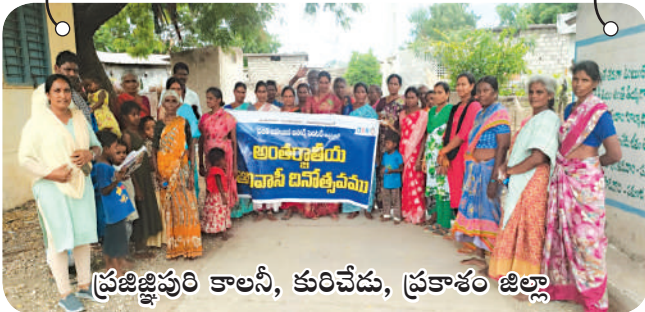
ప్రజ్ఞిపురి కాలనీ, కురిచేడు, ప్రకాశం జిల్లా