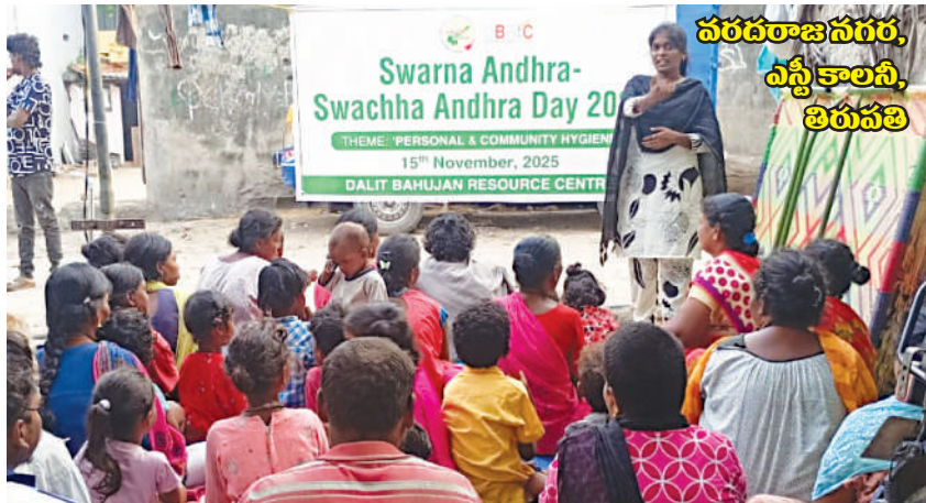
వరదరాజనగర, ఎన్టీకాలనీ, తిరుపతి

ఈ కార్యక్రమాలలో ఆరోగ్య కార్యకర్తలు, వార్డు ప్రజలు, సచివాలయం సిబ్బంది, డిబిఆర్సి ప్రతినిధులు పాల్గొన్నారు. *