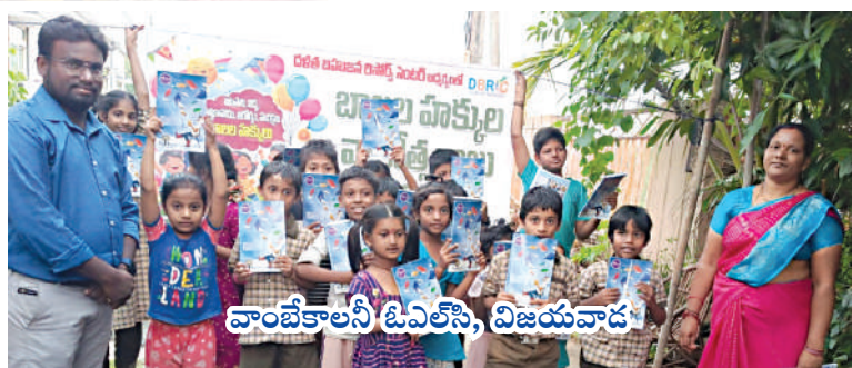
వాంబేకాలనీ ఓవెలసె, విజయవాడ