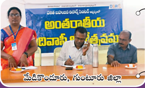
మేడికొండూరు, గుంటూరు జిల్లా