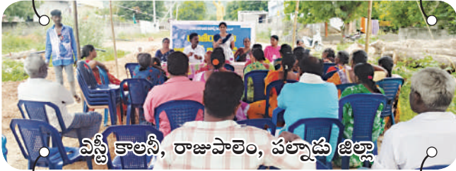
వస్త్రీ కాలనీ, రాజుపాలెం, పల్నాడు జిల్లా